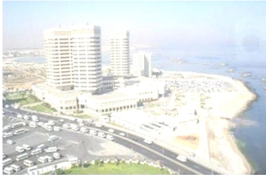
Libya with Gaddafi