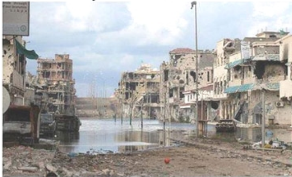
Libya with "American democracy"

I'M AN AFRICAN — THE DEATH OF MY BROTHER IS ALSO MY DEATH! Many foolish black middle classes and many foolish people «who are eating well» think they can sit in America and watch this country destroy the African continent, African Caribbeans, Africans in Central and South America, and think that these same people who destroy Africans abroad wouldn't be the same people who would destroy them in Ame...